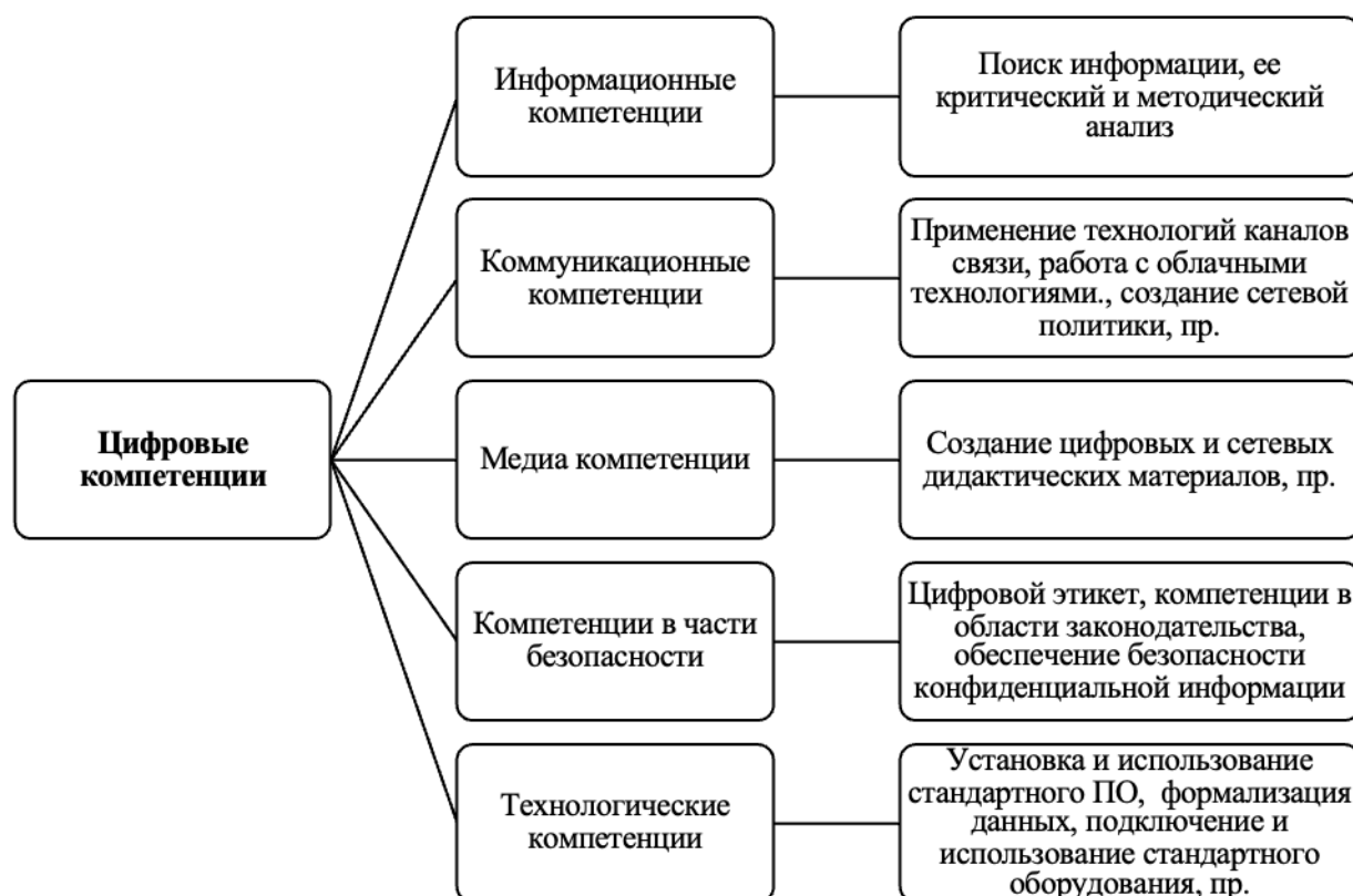
Рисунок 3. Карта цифровой компетентности педагога

Примечание: составлено с применением [14, С.29-38;15, С. 585-600]