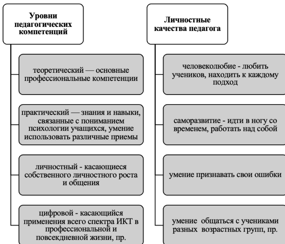
Рисунок 2. Структура педагогической компетентности и личных качеств педагога