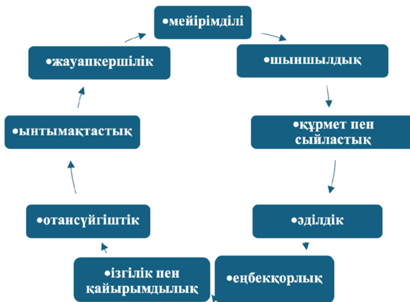
1-Сурет. Рухани-адамгершілік құндылықтардың негізгі құрамдас бөліктері

Рухани-адамгершілік құндылықтардың негізгі құрамдас бөліктерін төмендегі сурет 1-ден қарастыруға болады: