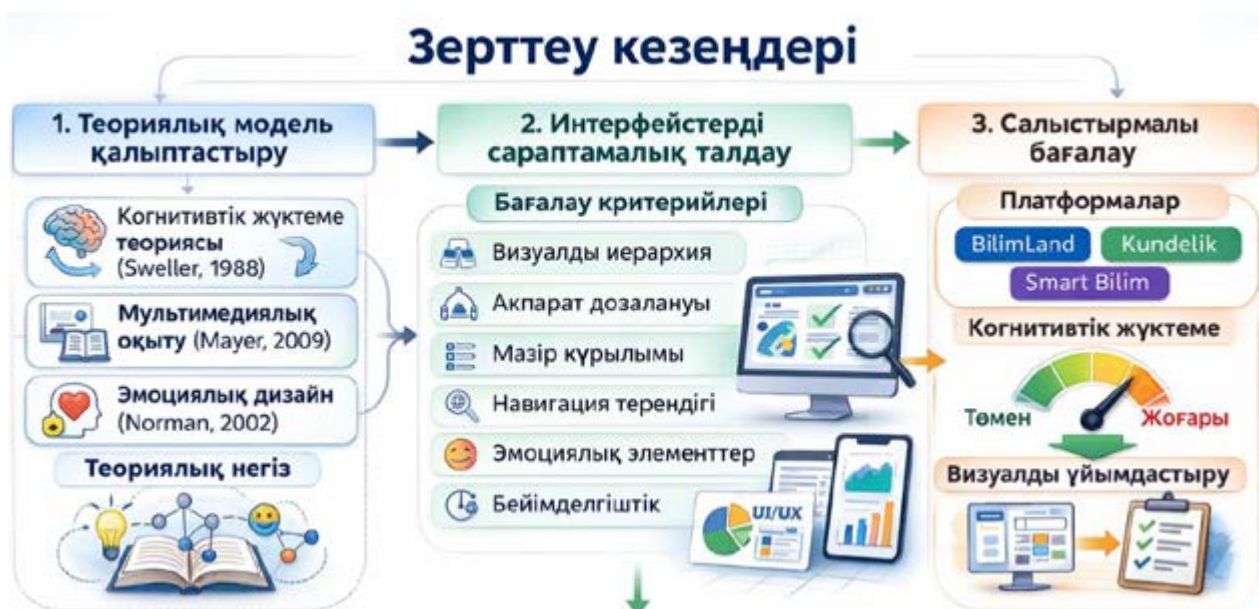
1-сурет. Зерттеудің үш кезеңі

- Салыстыру және талқылау кезеңі (2025 жылдың маусым айы): сарапшылардың бағалары матрицаға енгізілді, орташа мәндер есептелді, айырмашылықтар талқыланды және консенсусқа келді.