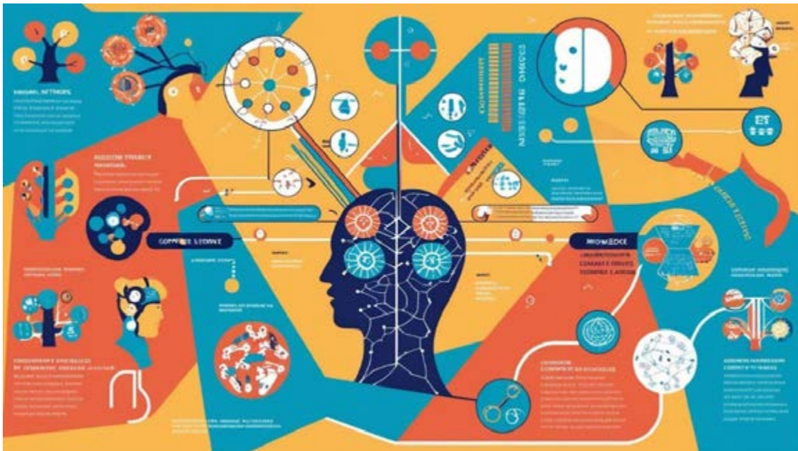
2-сурет. Танымдық дизайнға әсер ететін когнитивтік үдерістер

Қазақстандық білім беру жүйесінің ерекшеліктерін ескеру танымдық дизайнды жобалауда маңызды. Авторлық талдау барысында қазақ тіліндегі интерфейстерде ұлттық ою-өрнек элементтері, жұмсақ түстер мен визуалды иерархия қолданылған кезде білім алушылардың зейін деңгейі жоғары болатыны байқалды. Бұл қазақстандық цифрлық білім беру ресурстарын әзірлеуде этномәдени факторларды ескеру қажеттігін көрсетеді.